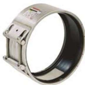
STRAUB-OPEN-FLEX 2/3 Ingelast