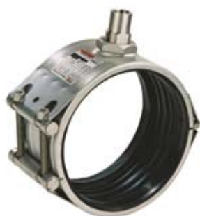
STRAUB-OPEN-FLEX GT Zij-aansluiting