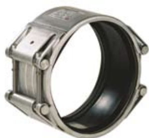
STRAUB-OPEN-FLEX 2/3 Tweedelig