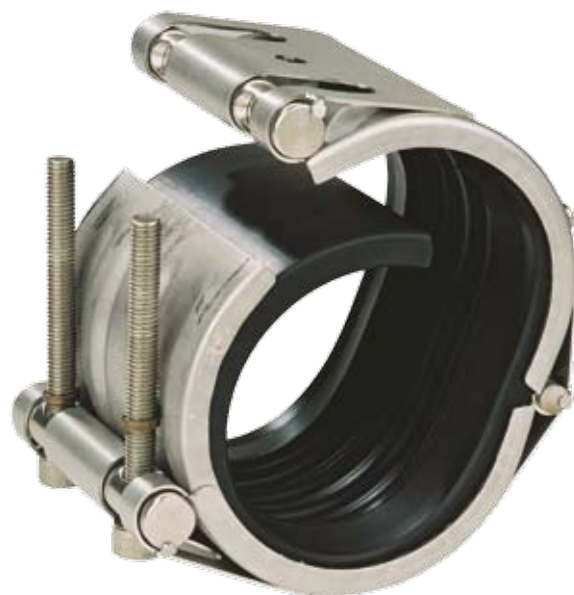
STRAUB-OPEN-FLEX 1 Scharnierontwerp

De STRAUB-OPEN-FLEX, een verbeterde versie van de STRAUB-REP, is de beste oplossing voor veeleisende installaties waar u een koppeling nodig heeft die lange tijd meegaat.